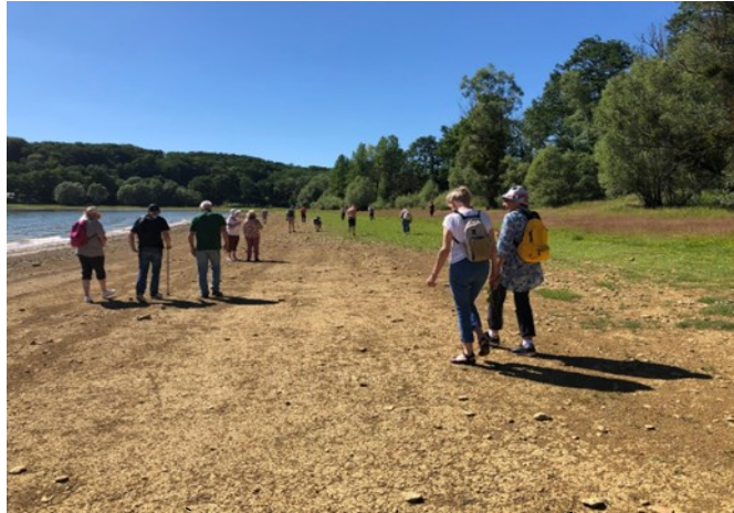
À la recherche des traces du passé...